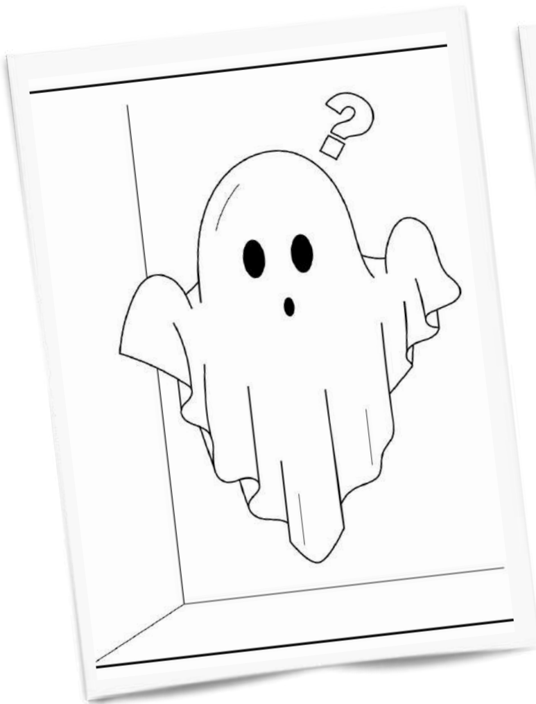
LES NOUVEAUX AMIS DE BOO